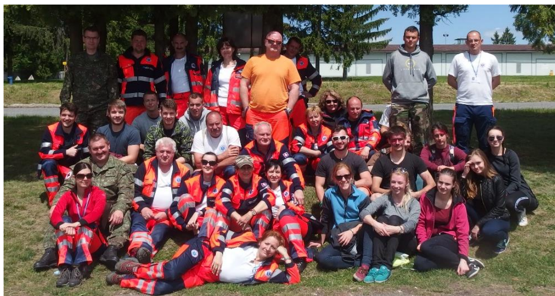
Druhý májový kolektív :