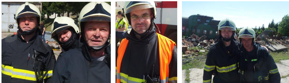
Prvý májový kolektív

A nemôžeme zabudnúť aj poďakovať Hasičskému zboru OS SR, ktorí nám svojou profesionálnou spoluprácou priblížili k realite zásahu v nebezpečných podmienkach.